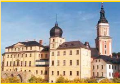
Greiz (25 km) Unteres und Oberes Schloss