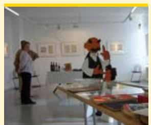
Galerie e.o. plauen