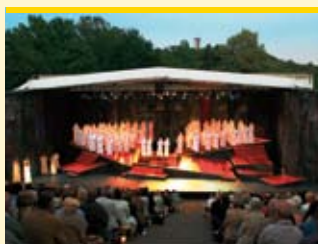
Open Air im Parktheater