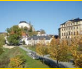
Gera (60 km) Stadtapotheke, Geraer Höhle