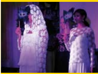
Faszination Plauener Spitze