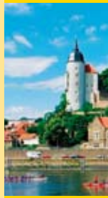
Meißen (140 km)