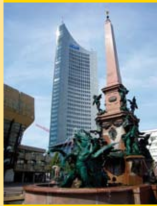
Leipzig (145 km) Augustusplatz, Völkerschlachtdenkmal