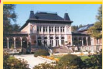
Nürnberg (165 km) Albrecht-Dürer-Haus, Kaiserburg