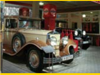
Zwickau (50 km) August-Horch-Museum, Priesterhäuser