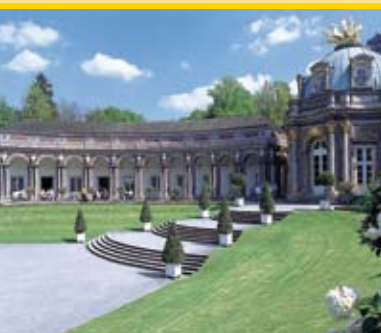
Bayreuth (85 km) Markgräflisches Opernhaus, Eremitage, Altes Schloss