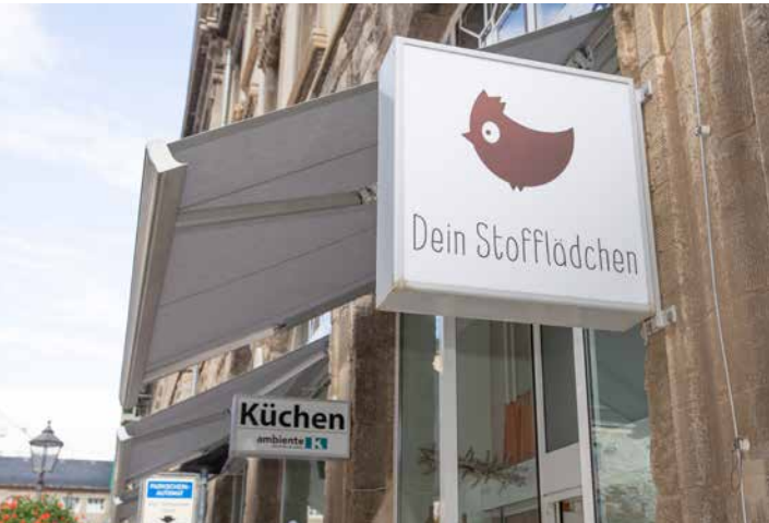
Markisen Marktstraße Erneuerung von Markisen bei den Läden von ambienteK und Süsstoffe | 2023

Sie haben Fragen? Wir helfen Ihnen gern: