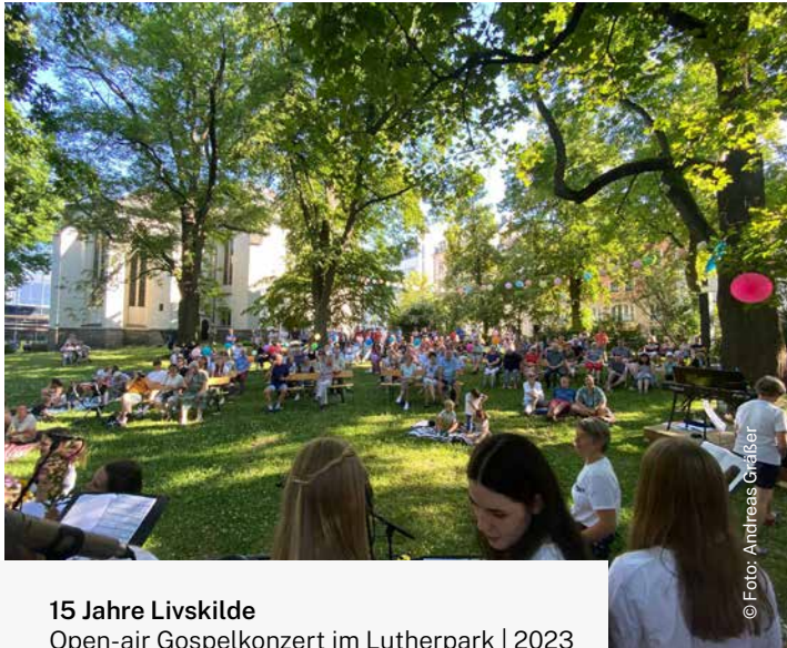
15 Jahre Livskilde Open-air Gospelkonzert im Lutherpark | 2023