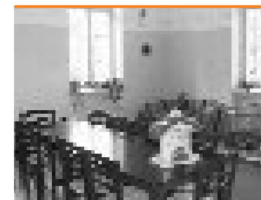
Familiencafé in des KJH „eSeF“

Es gibt nur eine wahrhafte Freude, den Umgang mit Menschen. (Antoine de Saint-Exupery, 1900-1944)