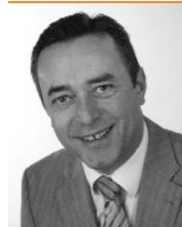
Ralf Oberdorfer Oberbürgermeister der Stadt Plauen