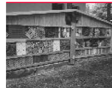
Insektenhotel in der Kindertageseinrichtung „Kosmonaut“